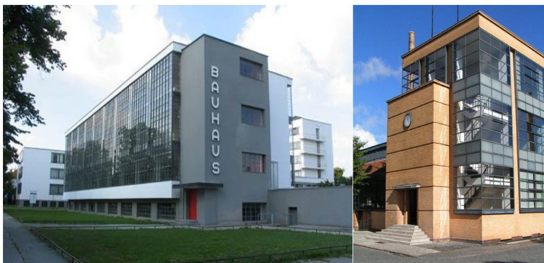
Рис. 2. Европейский функционализм Fig. 2. European functionalism

нет (рис. 2). Не присутствуют здесь ассоциации с образом человека, придающие архитектуре одухотворённость, и нет символов национальной культуры и истории (ещё одно название модернизма – «интернациональный стиль»), без которых никакое искусство таким не воспринимается. А присущ ли вообще конструктивизму архитектурный образ?