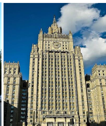
Рис. 5. Советский ар-деко Fig. 5. Soviet art deco

К сожалению, поучительный опыт этого периода остался не востребован. После Второй мировой