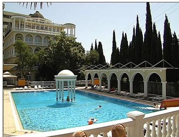
Рис. 10. Историческая традиция в крымских новостройках Fig. 10. Historical tradition in Crimean new buildings