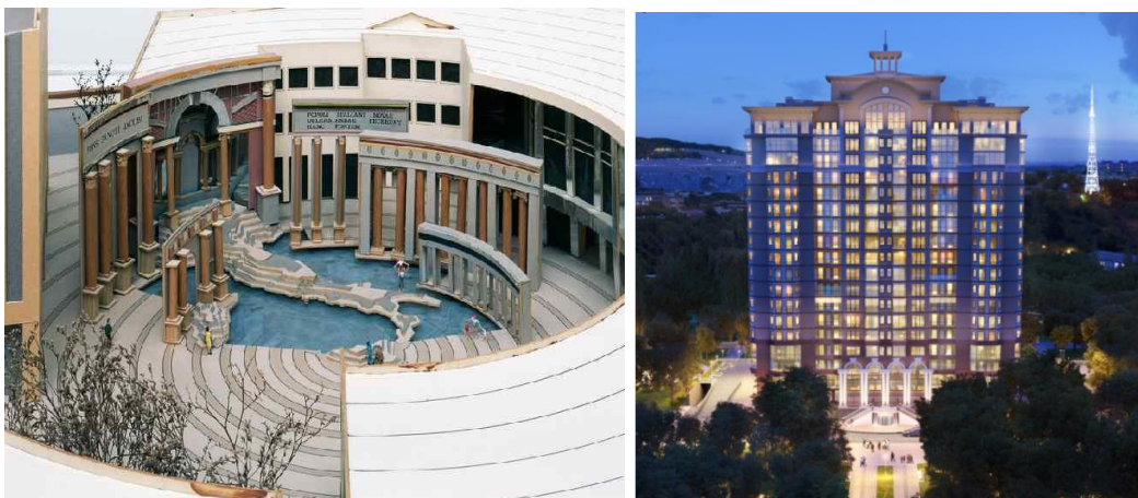
Рис. 9. Постмодернизм – возврат к исторической традиции