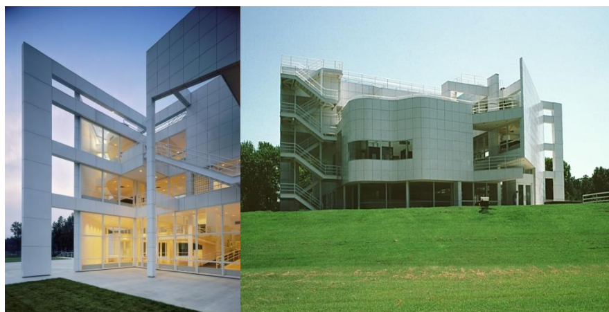
Рис. 8. Неоконструктивизм – развитие модернизма Fig. 8. Neoconstructivism - the development of modernism

Эволюция и совершенство её результатов – вот ключевое понятие, наиболее подходящее в качестве аргумента в поисках истины в данном вопросе. Однако, несмотря на весомость этого аргумента, профессионалы по-прежнему продолжают делиться на две категории – модернисты и приверженцы традиции. В этих направлениях и продолжают поиски настоящей современной архитектуры (рис. 8, 9).