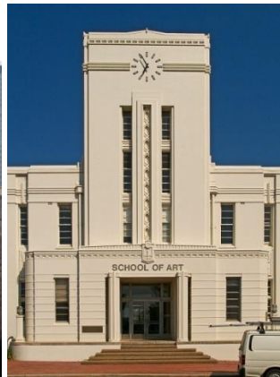
Рис. 3. Американский ар-деко Рис. 4. Европейский ар-деко Fig.3. American Art Deco Fig. 4. European Art Deco

Период ар-деко и советского неоклассицизма в СССР, который называют «сталинский ампи́р», знаменателен тем, что в это время вынуждено и в известной мере случайно возникло много интересных сочетаний нового и старого, конструктивизма и классицизма (рис. 5). Выяснилось, что для развития новой архитектуры