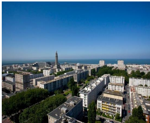
Рис. 7. Восстановленный после Второй мировой войны французский Гавр Fig. 7. French Le Havre restored after World War II

Революция и эволюция. С тех пор волнообразный процесс этих перемен стал хроническим и привычным: маятник продолжает качаться от классицизма к модернизму и обратно также и в наше время. И хоть всякий раз эти направления возникают под другими именами, их основное содержание не меняется.