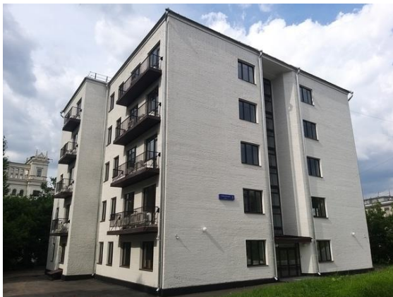
Рис. 6. Советский конструктивизм 60-х годов Fig. 6. Soviet constructivism of the 60s

решались таким же путем (рис.7). Но если первая волна конструктивизма явила некоторые интересные достижения хотя бы в области объёмной композиции, то теперь и это отнесли к «излишествам». Серость и монотонную безликость того периода мы наблюдаем до сих пор [6].