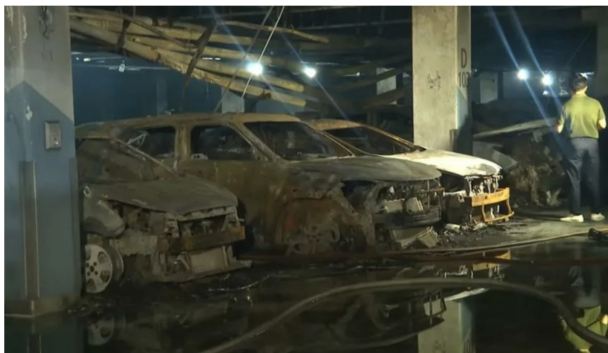
Рис. 1. Закрытый паркинг для электромобилей после пожара (Корея) Fig. 1. Closed parking for electric vehicles after a fire (Korea)

Необходимо отметить, что литий-ионные батареи различных модификаций имеют ряд преимуществ перед традиционными кислотнo-щелочными аккумуляторами по емкости, скорости зарядки и долговечности [13-16]. При этом физико-химические процессы, происходящие внутри батареи при ее повреждении или неправильной зарядке, обуславливают развитие специфического пожара из-за эффекта теплового разгона. В этом случае традиционная тактика тушения с использованием большого количества воды или пены не дает требуемого результата, а в условиях ограниченного пространства паркинга обуславливает высокий риск развития массового пожара: пожар электромобиля имеет большую в два раза проектную мощность по сравнению с обычным автомобилем с бензиновым двигателем внутреннего сгорания, что вызывает перегрев потолочного перекрытия над очагом пожара до 400–600 °С; продукты сгорания литий-ионного аккумулятора высокотоксичны и являются даже более опасным фактором пожара, чем теплоизбытки (рис.1).