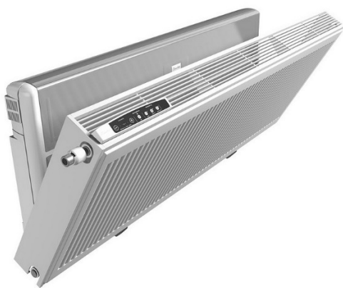
Рис. 3. Внешний вид установки.

1 – Air filter section; 2 – supply fan; 3 – exhaust fan; 4 – heat exchanger; 5 – humidity sensor; 6 – CO 2 sensor.