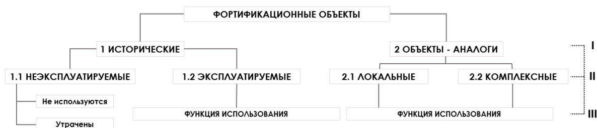
Рис. 2. Классификация фортификационных объектов [рисунок авторов] Fig. 2. Classification of fortification objects [authors' drawing]

На основе проведенного анализа создана трех ступенчатая классификация (рис. 2), которая позволяет формально представить систему фортификационных объектов, используемых в современных условиях. На I уровне предлагается выделить две большие группы: исторические комплексы и объекты-аналоги. II уровень – функциональный, содержит информацию по использованию каждой группы объектов. III уровень содержит «функцию использования».